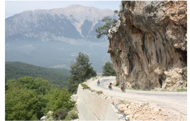
При подъезде к с.Овачик