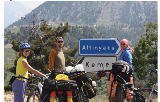
Развилка на перевале в районе Овачика