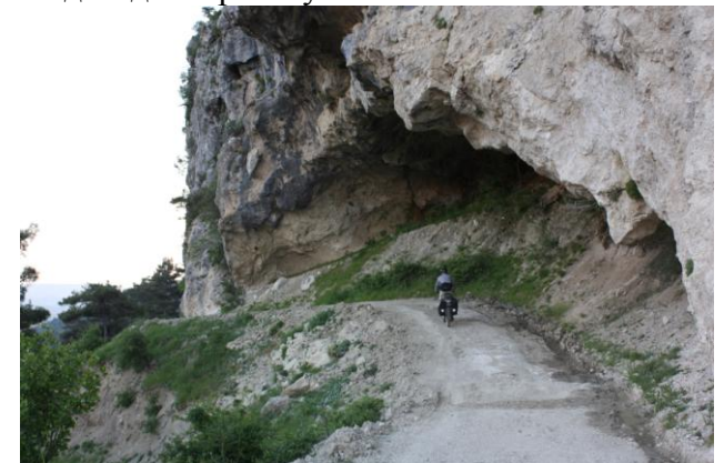
Дорога возле с.Эсилбаг