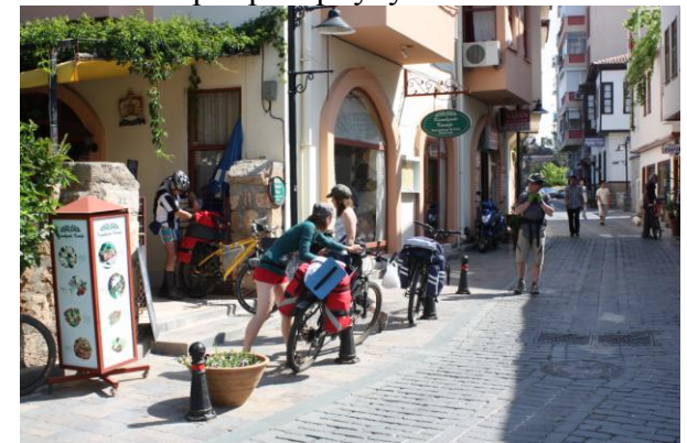
Улочки Старого Города в Анталии