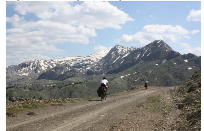
Подъезд к перевалу 1810