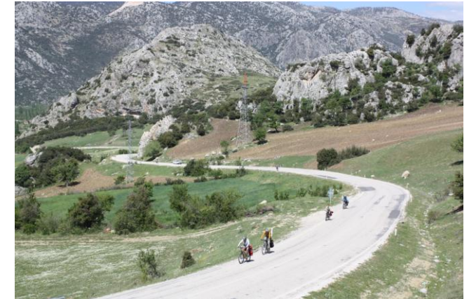
Подъем от оз.Эгирдир к пос.Агылкой