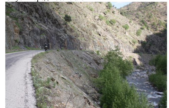
В каньоне р.Корпулу