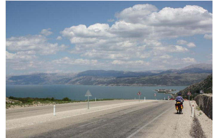
Вид на озеро Эгирдир