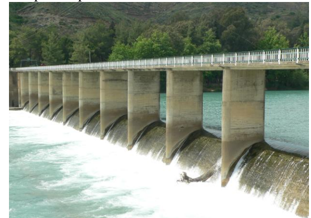
Плотина через р.Корпулу