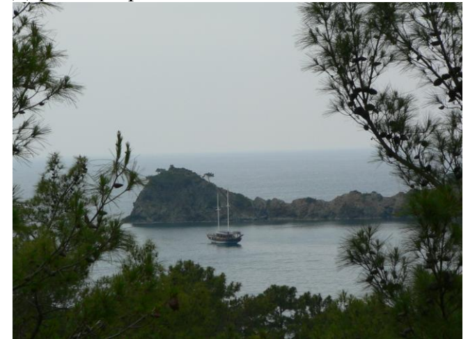
Бухта Клеопатры рядом с г.Текирова