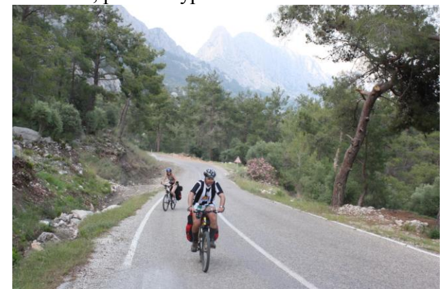
Дорога в Хисанчандир