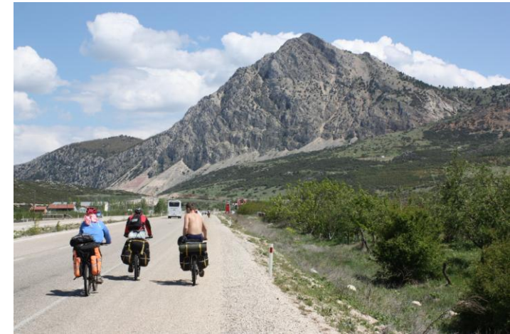
По дороге в Эгирдир