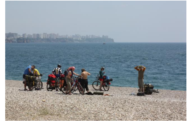
Городской пляж в Анталии