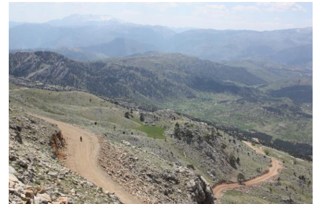
Серпантин на перевал Эмередан-Бели