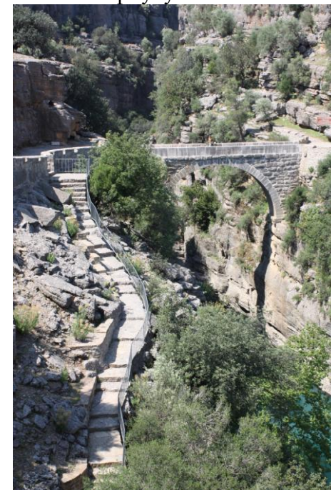
Мост Александра Македонского