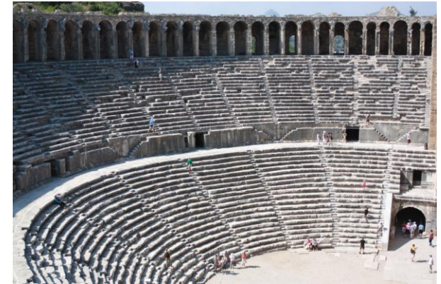
Амфитеатр в Аспендосе