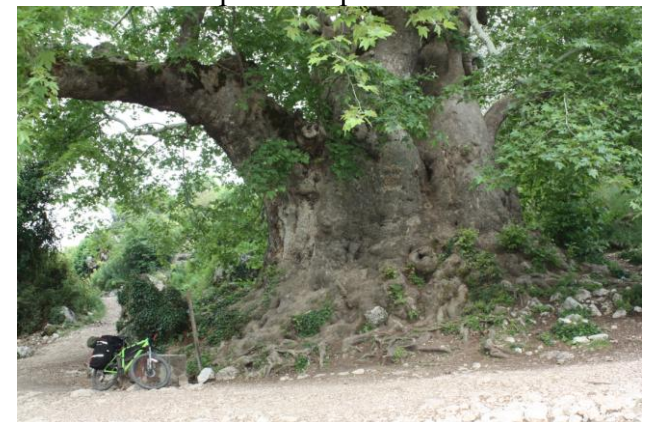
Гигантский платан в районе с.Овачик