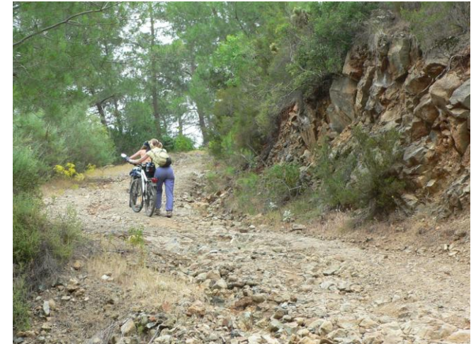
Дорога в Чирали