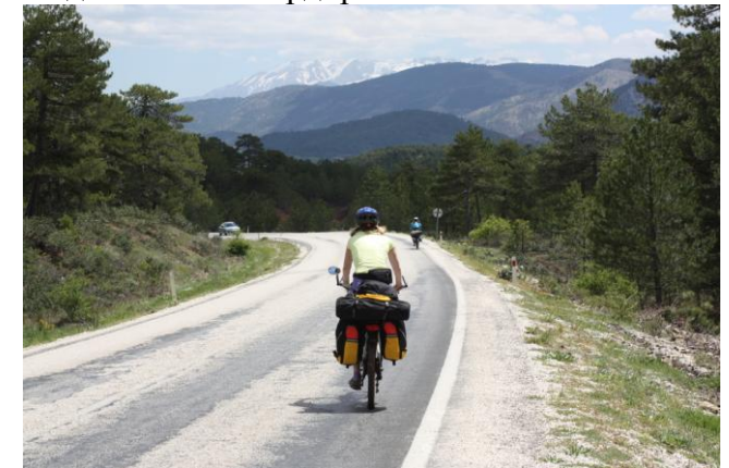
Спуск перед пос.Иланли